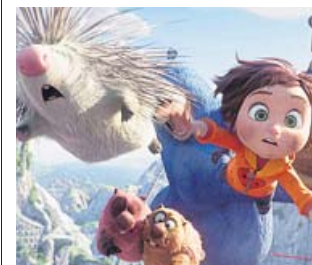
Subidón de adrenalina con June y sus amigos.

Esta producción española cuenta las aventuras de June, una niña con una imaginación desbordante que crea un parque de